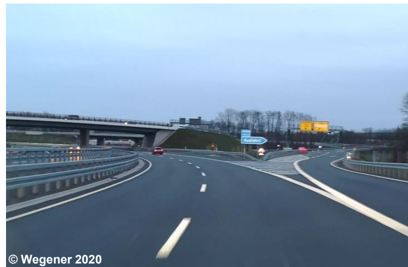
Blick auf eine Anschlussstelle