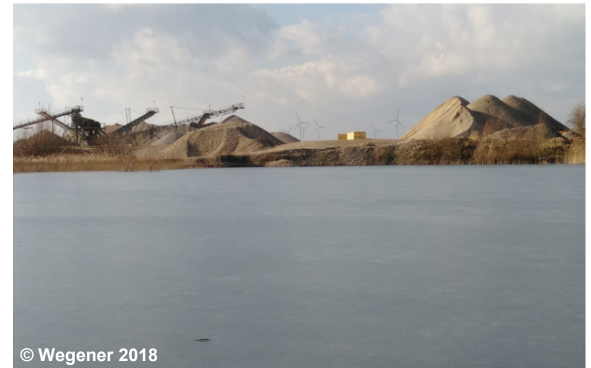
Blick auf den Tagebau