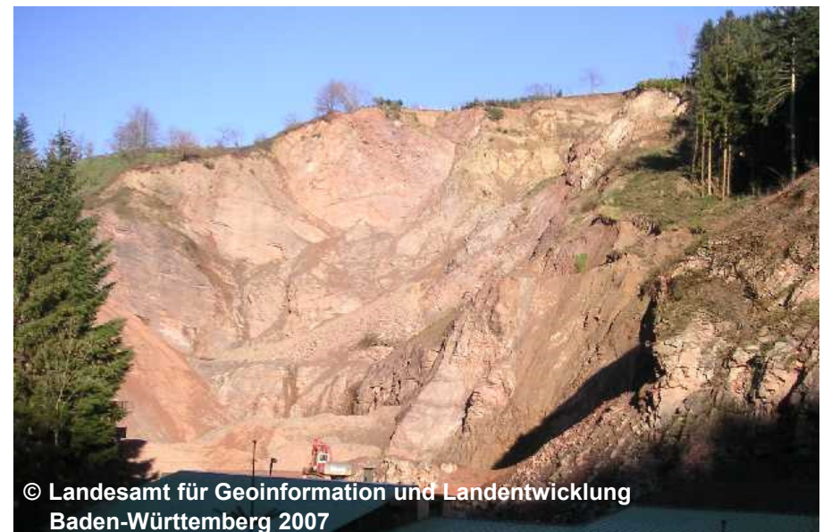
Blick auf einen Steinbruch