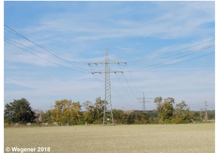
Beispiel für eine Freileitung