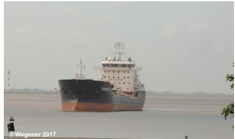
Blick auf einen Flussmündungstrichter