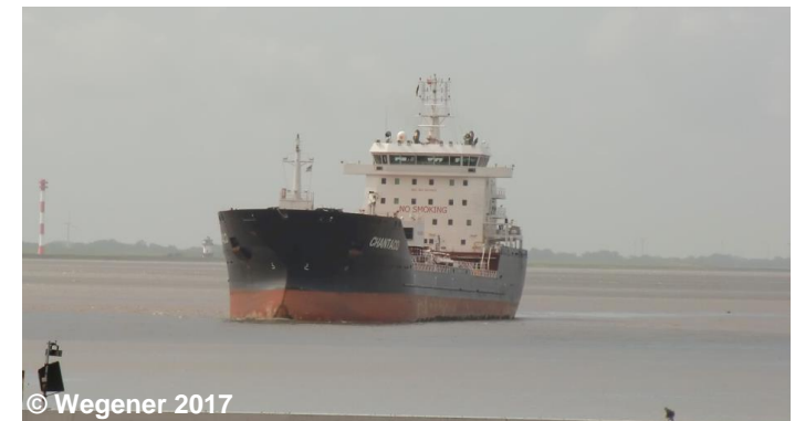
Blick auf einen Flussmündungstrichter