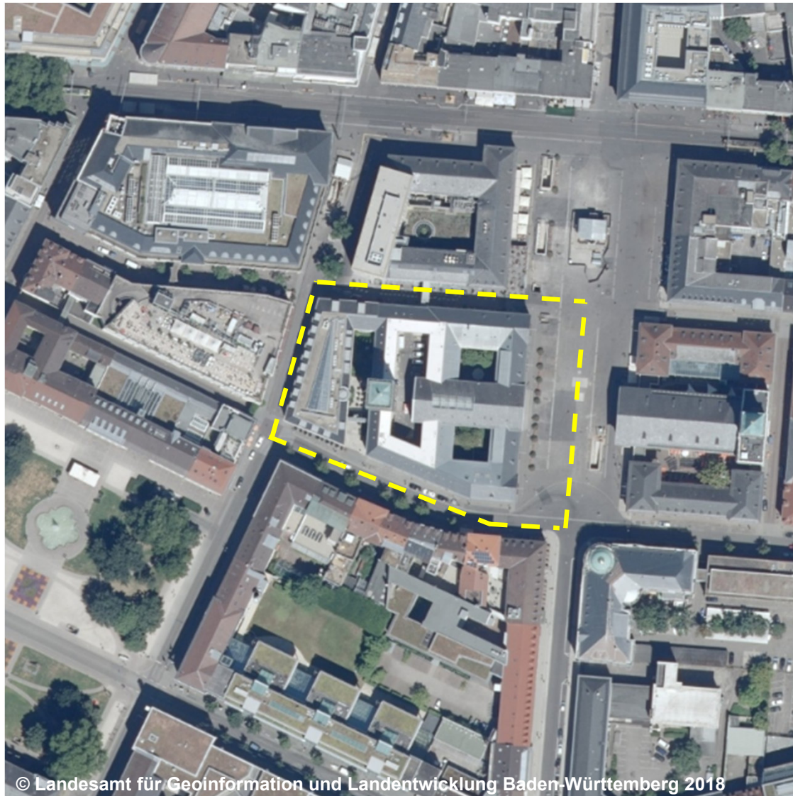
© Landesamt für Geoinformation und Landentwicklung Baden-Württemberg 2018