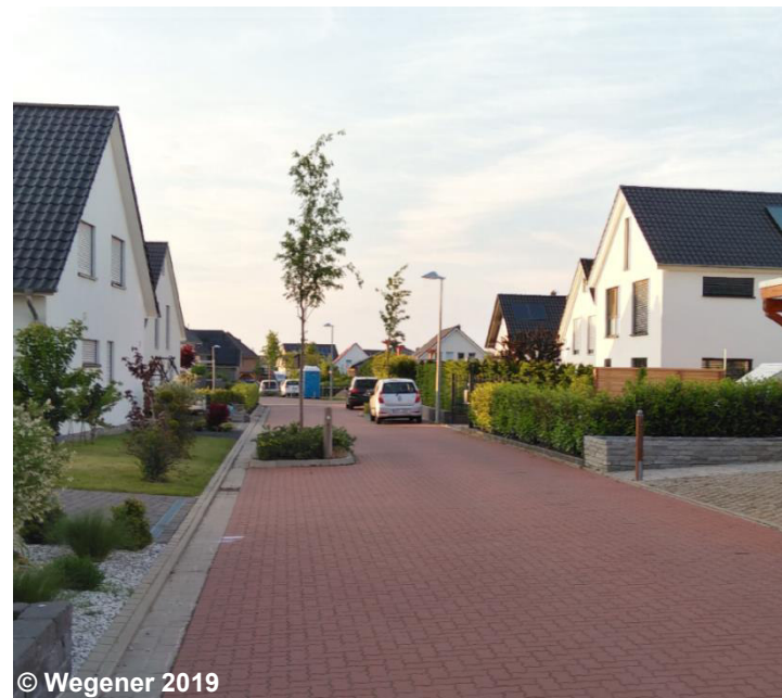
Beispiel für eine Wohnbaufläche