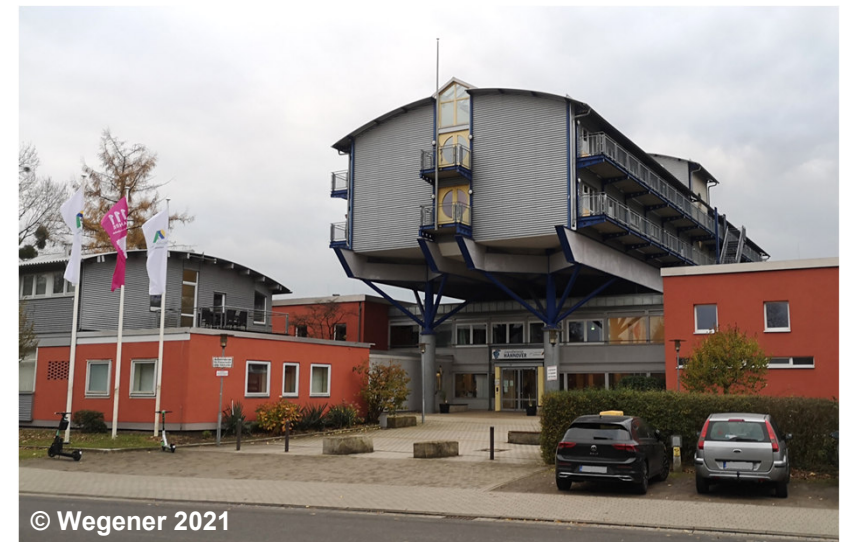
Blick auf das Beherbergungsgebäude

Da es sich um eine Wertart mit Landnutzung true handelt, wird bei eindeutiger Erkennbarkeit eine Erfassung auch bei Unterschreitung des Erfassungskriteriums empfohlen.