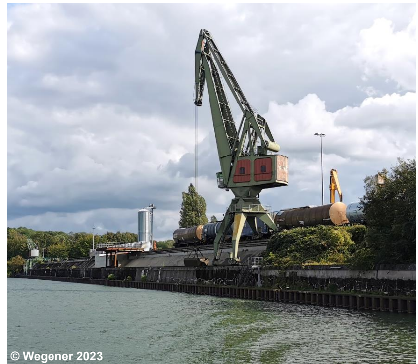
Blick auf den Kran