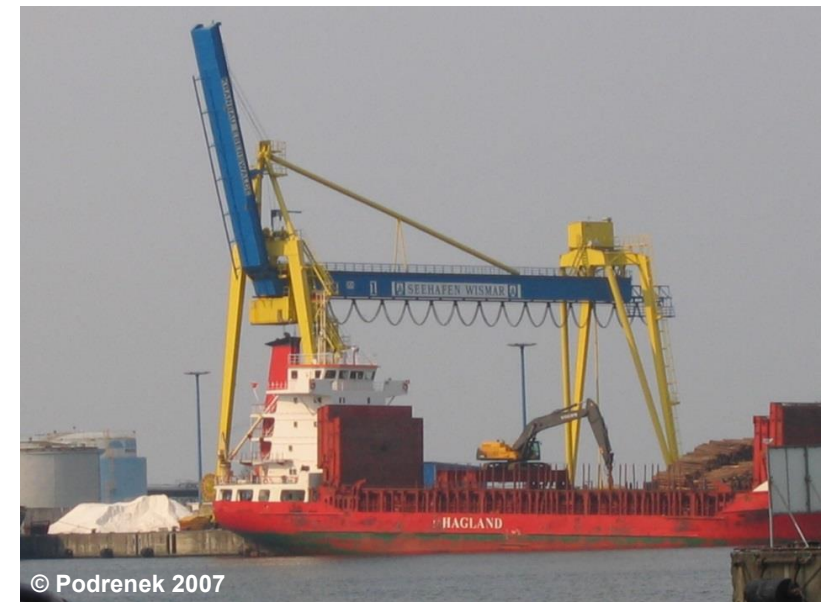
Beispiel für einen Kran