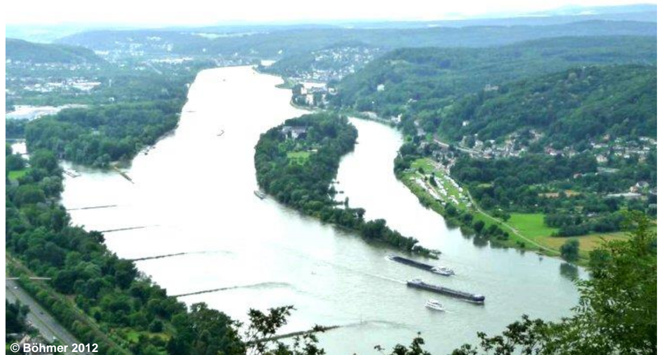
Blick auf die Insel