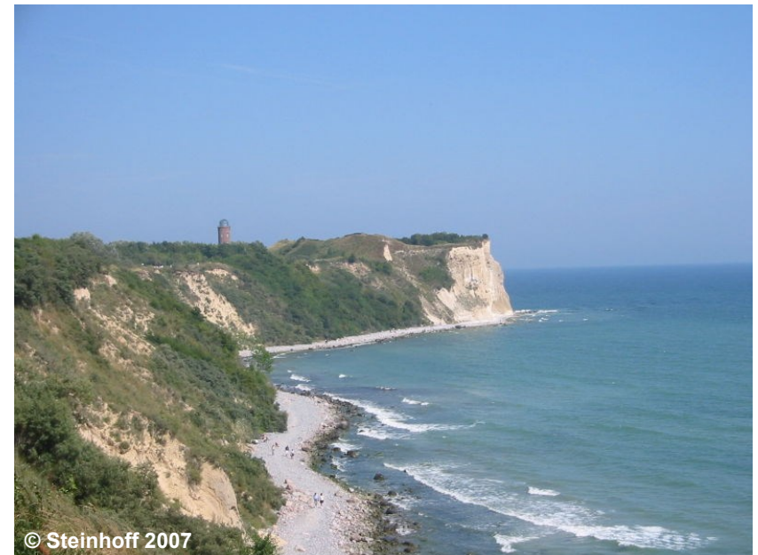
Blick auf eine Kliffkante