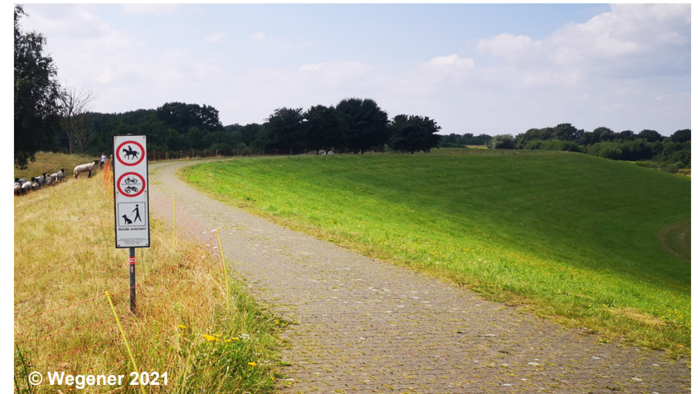
Blick auf den Hochwasserschutzdeich mit Verkehrsführung