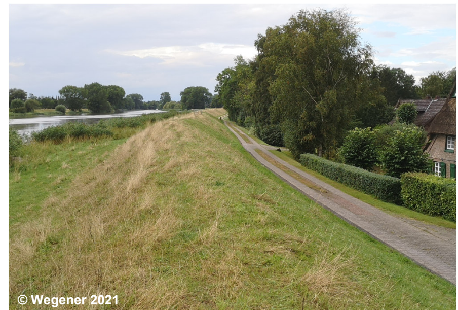
Beispiel für einen Hochwasserschutzdeich

Die Modellierung des Objektes erfolgt auf der Grundlage von Fachinformationen.