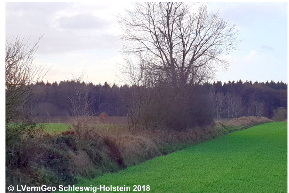
Blick auf einen Knick