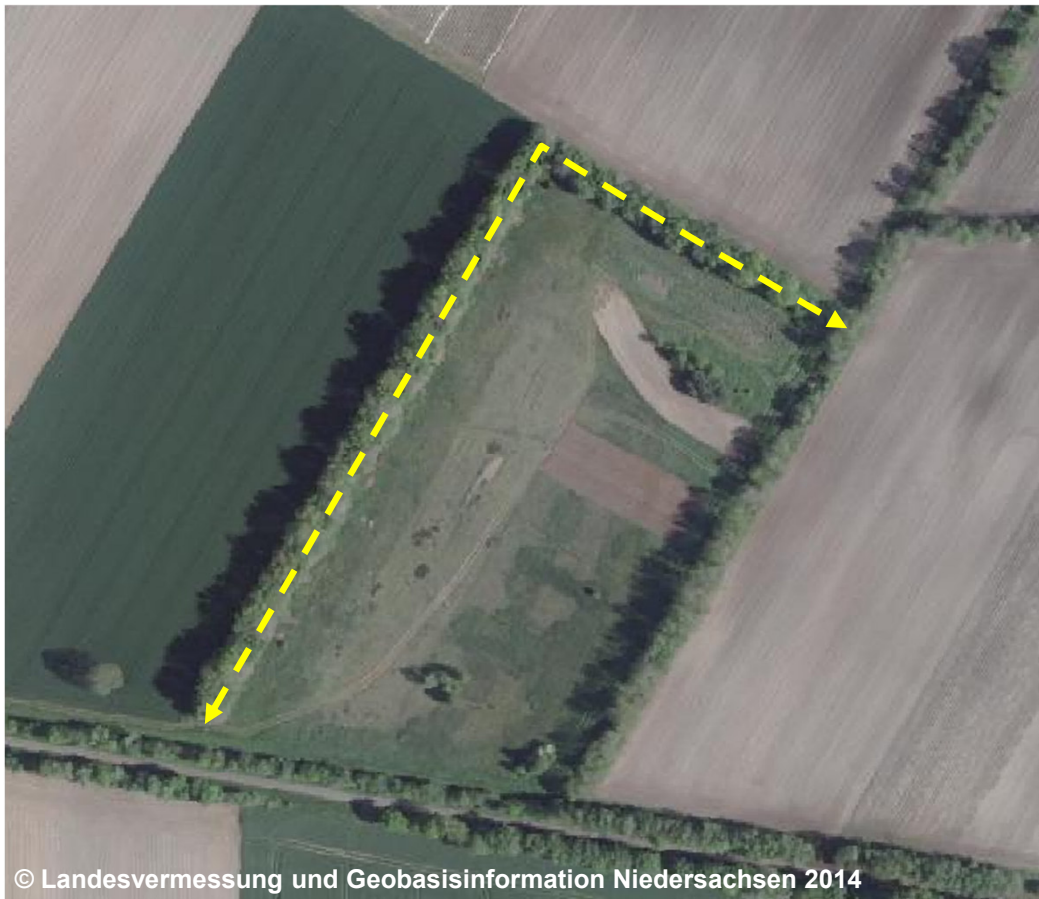
© Landesvermessung und Geobasisinformation Niedersachsen 2014

Über die hier vordefinierte Attributbelegung können zukünftige Inhalte bereits heute erfasst werden. Durch den Eintrag ‘ART2000 Knick’ in der Migrationstabelle zum AAA-AS 7.1.1 ist gewährleistet, dass migrierte Objekte mit dem Attribut ‘ART’ und der Wertart 2000 ‘Knick’ belegt werden.