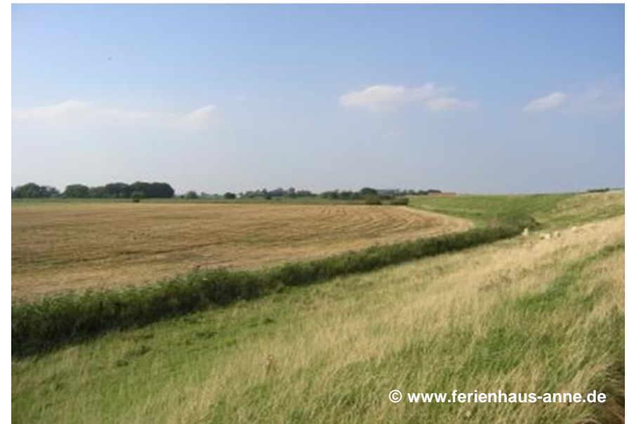
Beispiel für einen Polderdeich