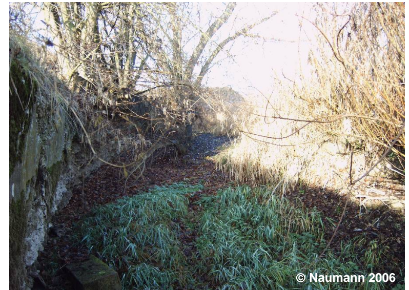
Blick auf die Sickerstrecke

NAM Elstergraben (G) ZNM .... GWK .... (G)