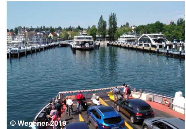
Blick auf einen Autofährverkehr

57002 'Schiffahrtslinie, Fährverkehr' mit ART 1710 oder ART 1720 muss geometrisch an mindestens eine weitere 57002 'Schiffahrtslinie, Fährverkehr', 42003 'Straßenachse' 42005 'Fahrbahnachse', 42008 'Fahwegachse' oder 42014 'Bahnstrecke' anschließen.