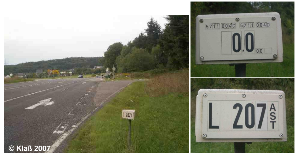
Blick von 5711004A nach Norden