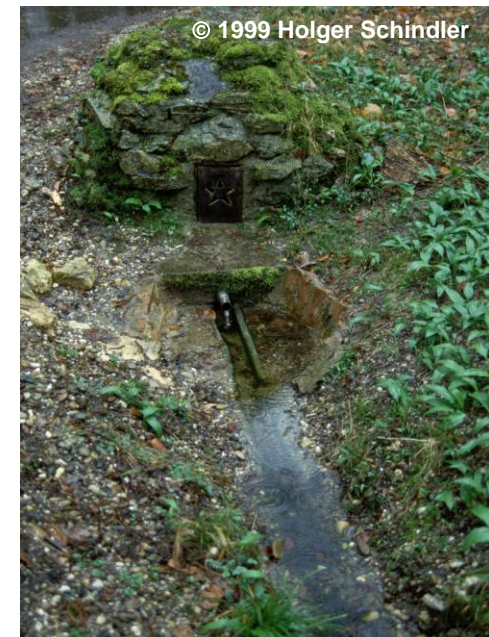
Beispiel für eine Quelle, nicht ständig Wasser führend