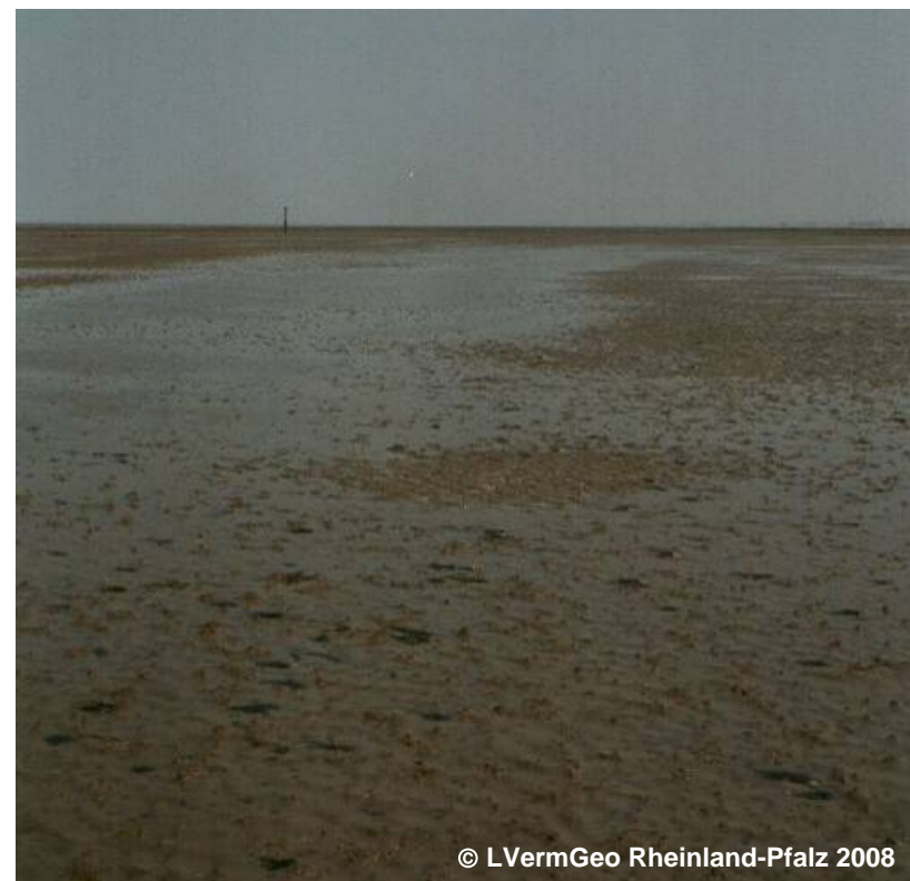
Beispiel für Watt