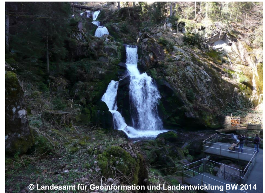
Blick auf die Wasserfälle

ART 1620 Wasserfall (G) NAM Triberger Wasserfälle (G) HHO 90