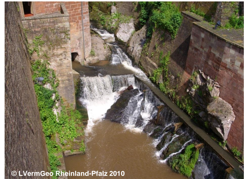
Blick auf den Wasserfall