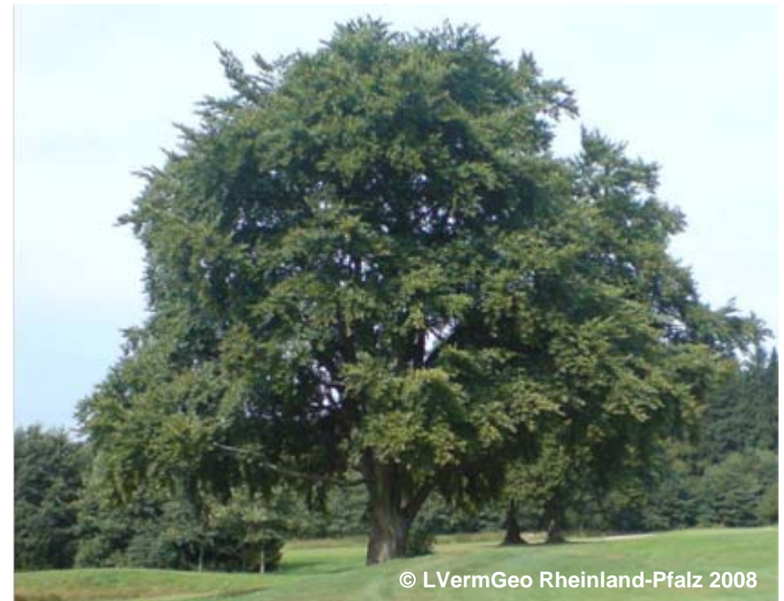
Beispiel für einen Laubbaum