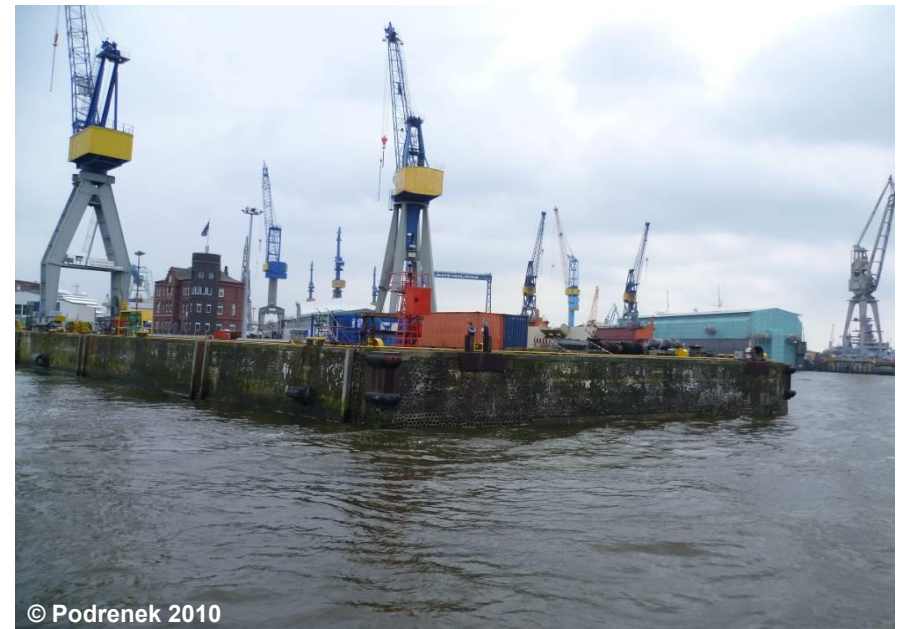
Blick auf den Höft