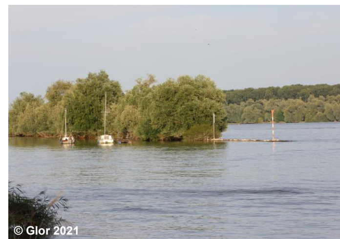
Blick auf die Buhne