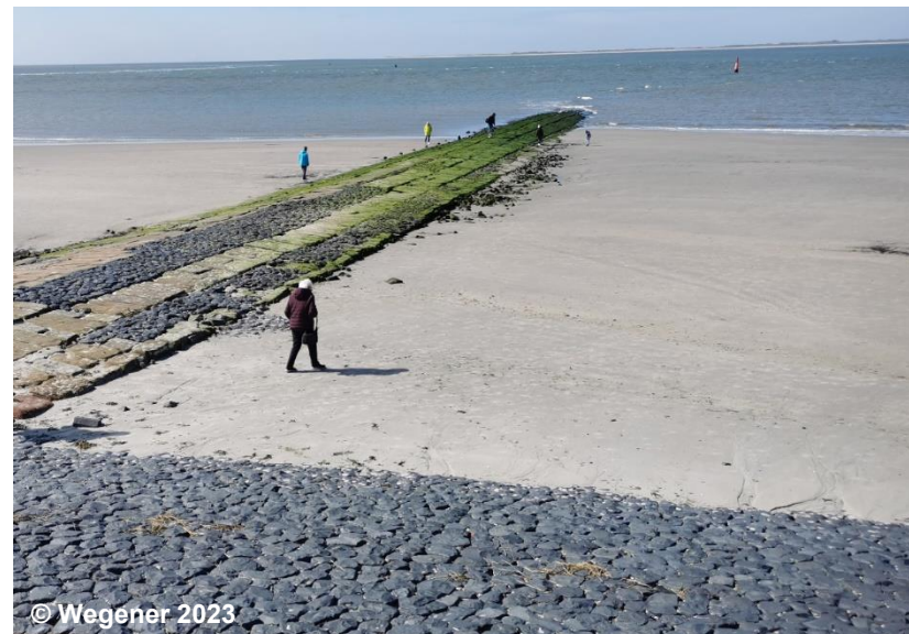
Blick auf den Wellenbrecher