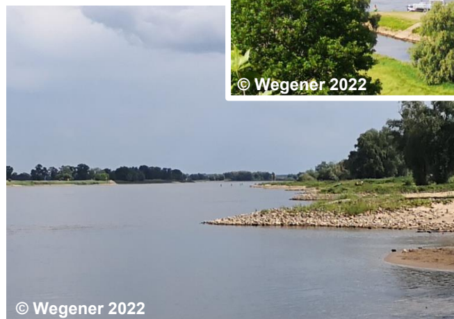
Blick auf die Buhne