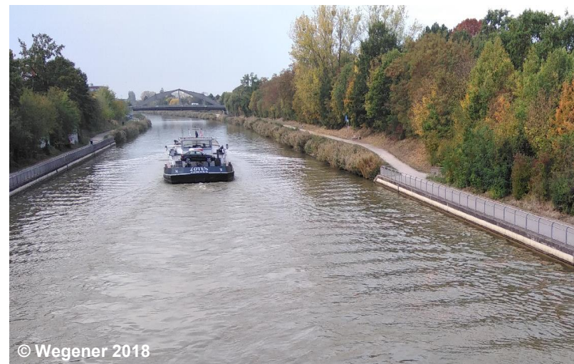
Blick auf die Uferbefestigung