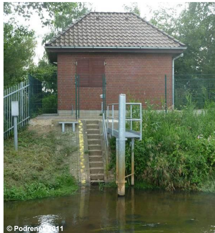
Blick auf den Pegel

Die Modellierung des Objektes erfolgt auf der Grundlage von Fachinformationen.