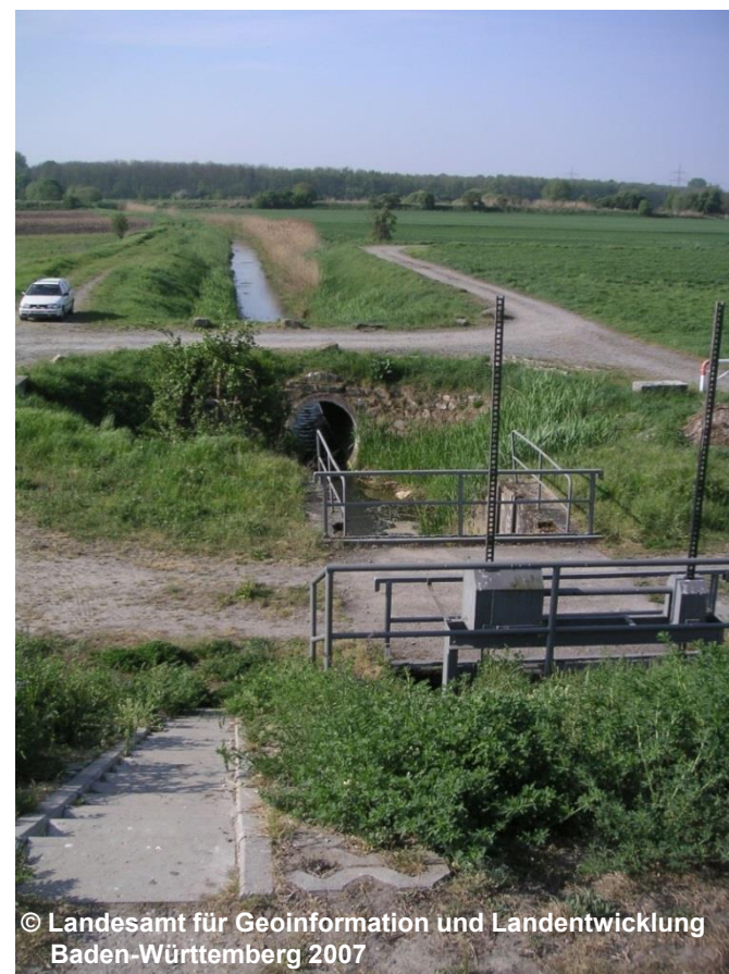
Blick auf den Rohrdurchlass