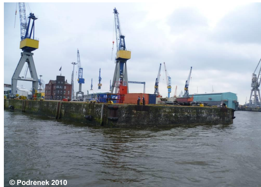
Blick auf den Höft