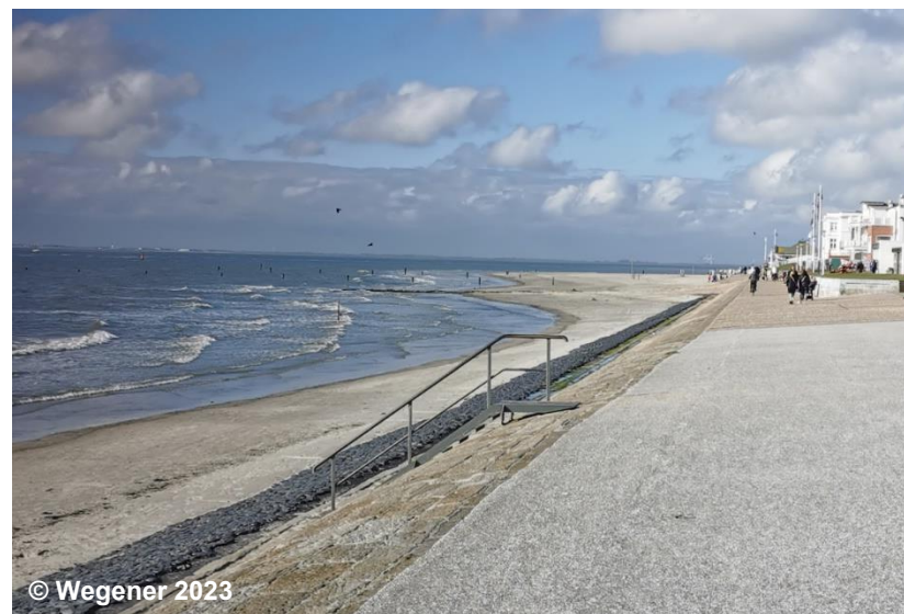
Blick auf die Uferbefestigung