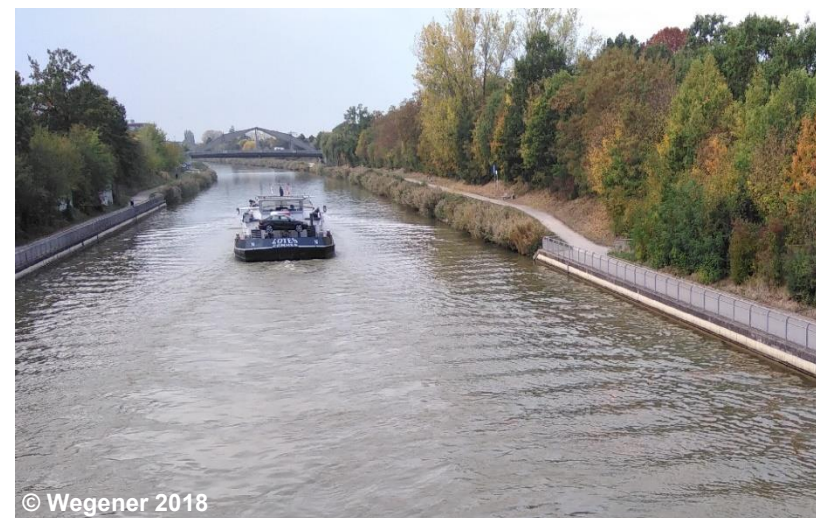
Blick auf die Uferbefestigung