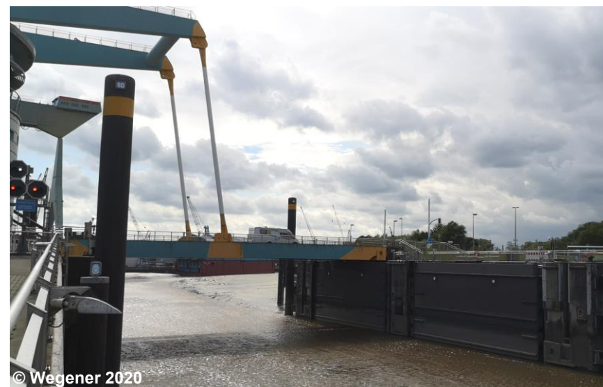
Blick auf die separate Brücke über dem Sperrwerk