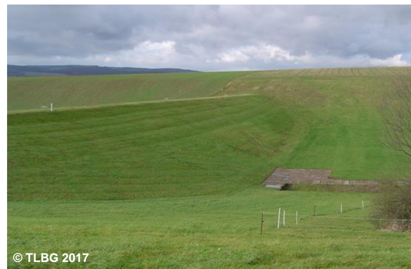
Blick auf den Staudamm