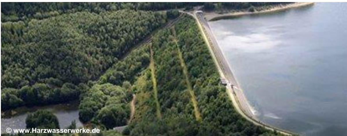
Blick auf den Staudamm