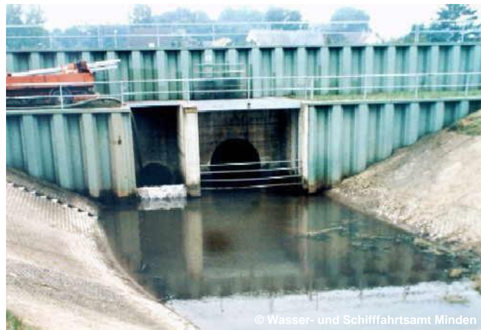
Blick auf den Düker