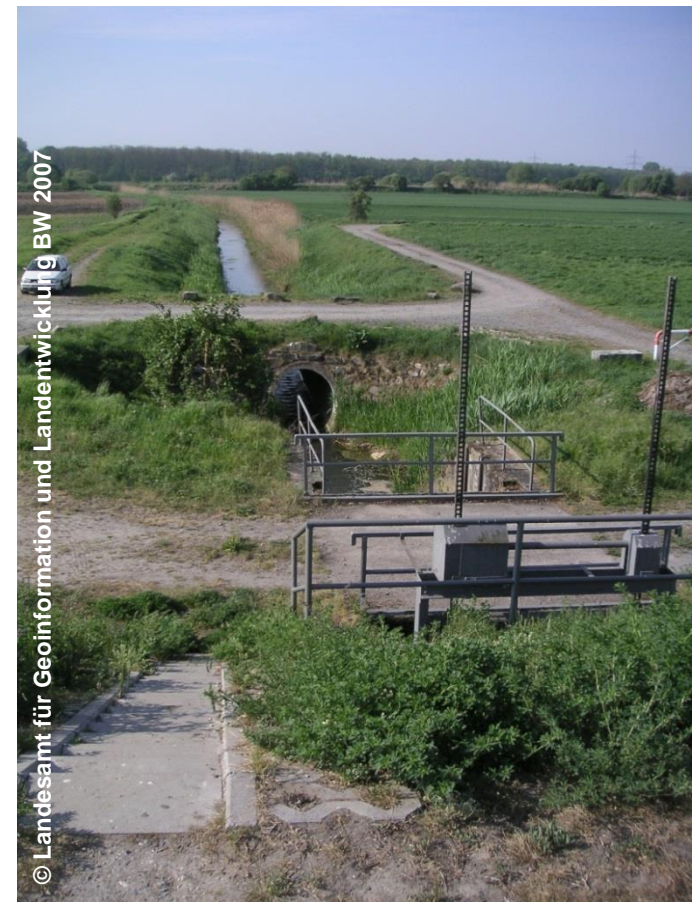
Blick auf den Rohrdurchlass