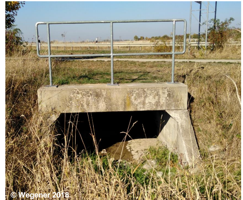
Blick auf den Durchlass