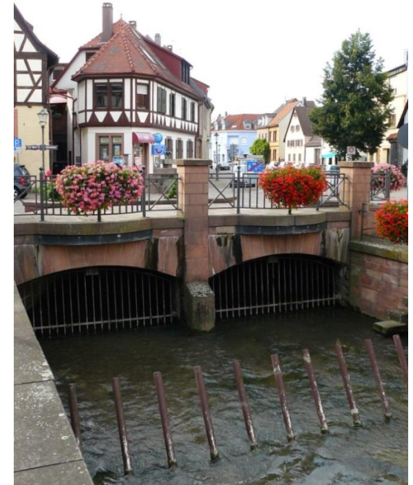
Blick auf den Durchlass