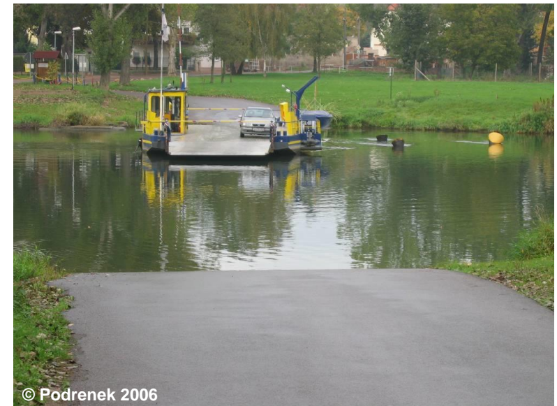
Beispiel für einen Anleger