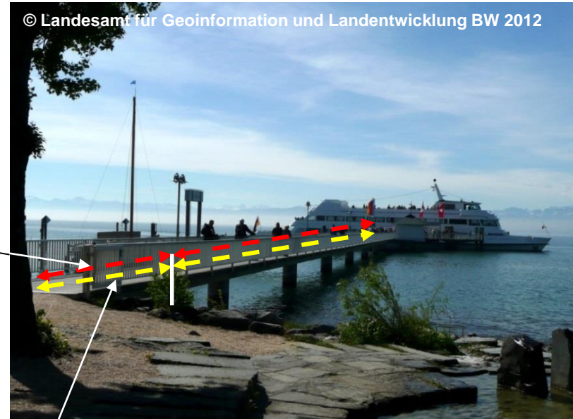
Blick auf den Anleger