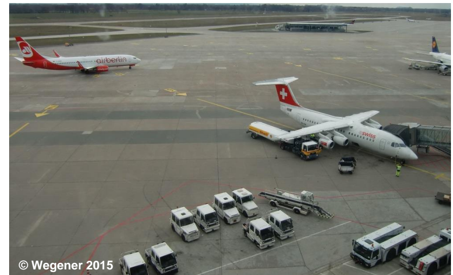
Blick auf die Flugverkehrsanlage mit dem Oberflächenmaterial Beton