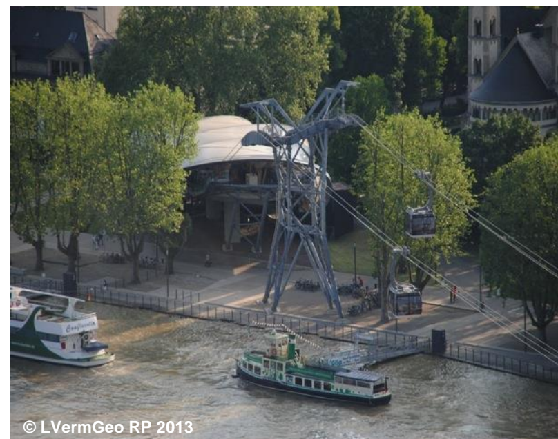
Blick auf die Kabinenbahn