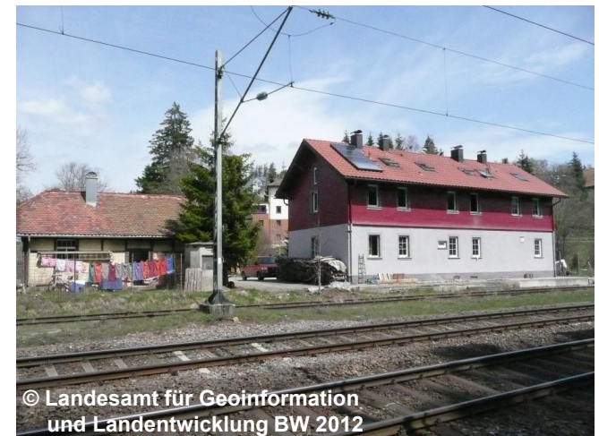
Blick auf den Bahnhof außer Betrieb, stillgelegt, verlassen