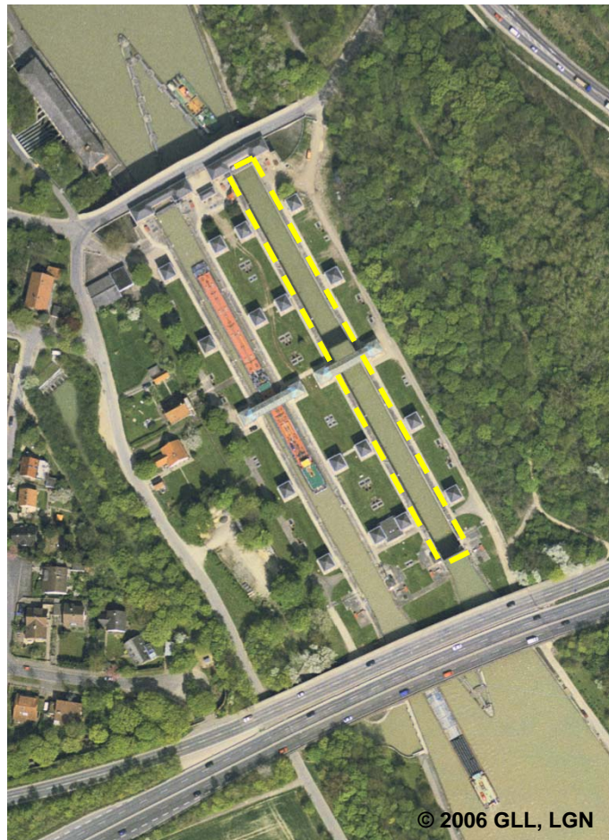
BWF 1890 Schleusenammer (G)

Erfassungskriterium: wird nur innerhalb von flächenförmig modellierten Schleusen erfasst