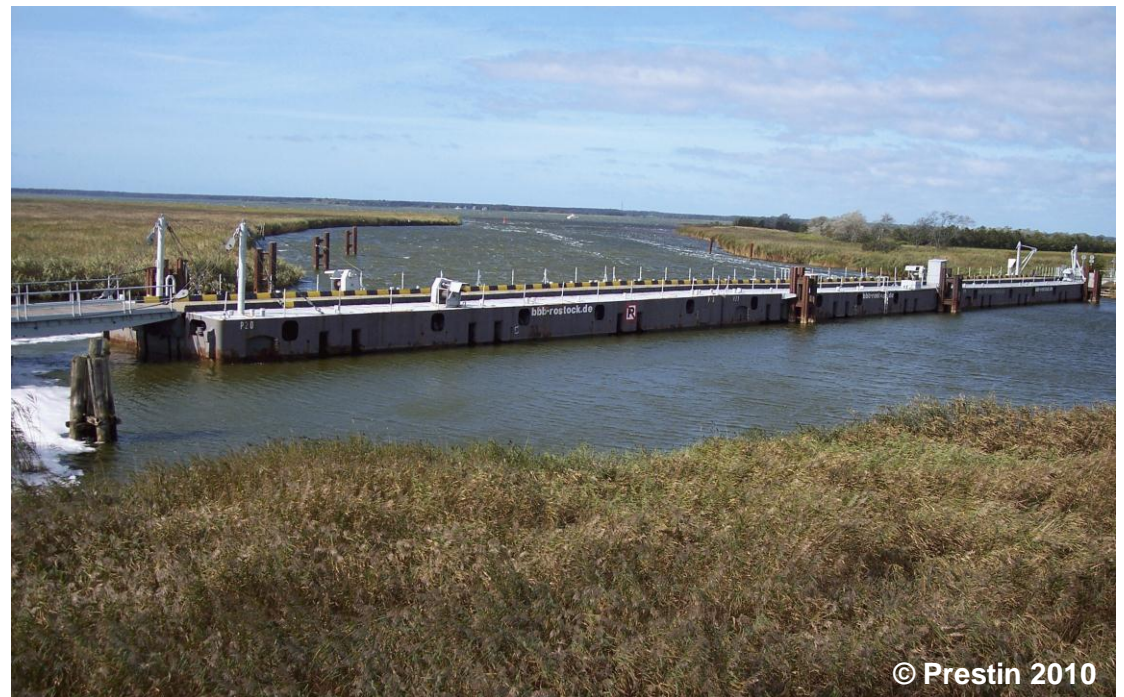
Blick auf die Pontonbrücke