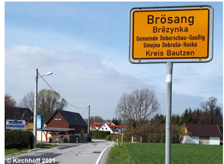
Blick auf das zweisprachige Ortsschild