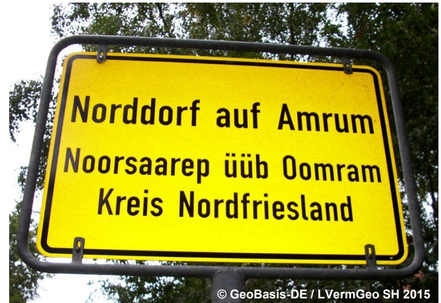
Blick auf das zweisprachige Ortsschild