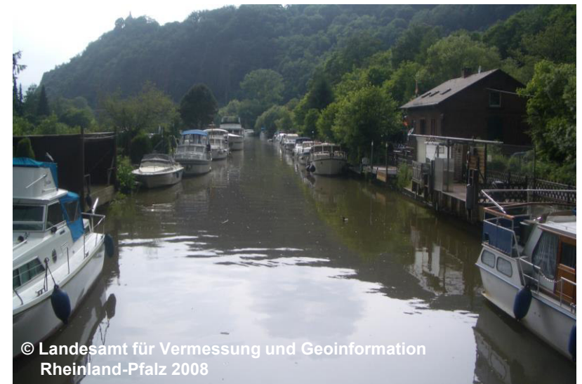
Blick auf die stillgelegte Schleuse