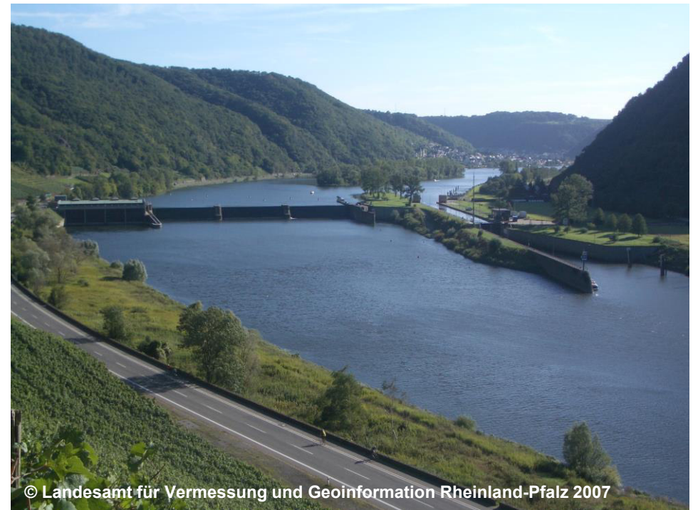
Blick auf die Kammerschleuse