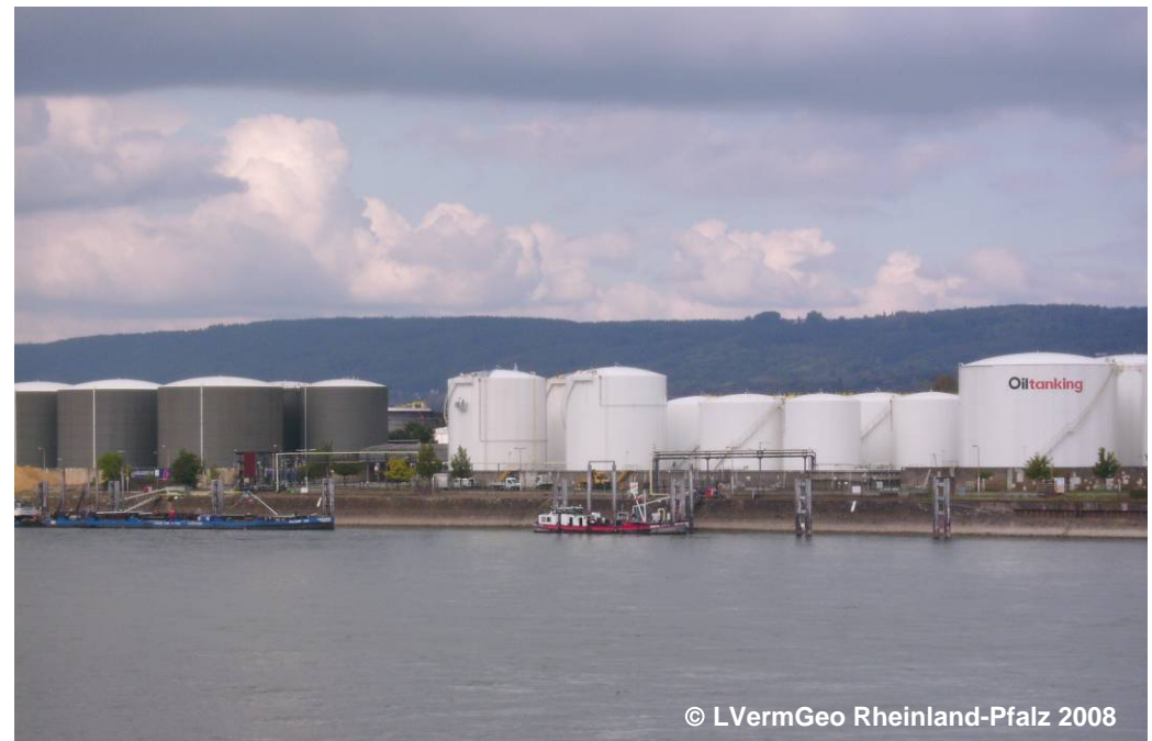
Beispiel für einen Ölhafen