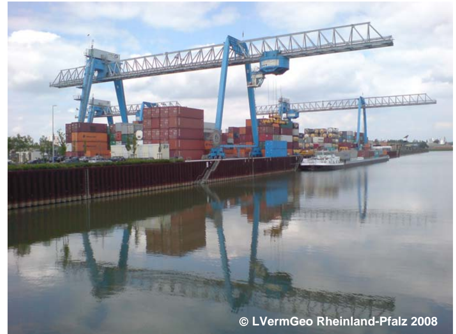
Beispiel für einen Hafen