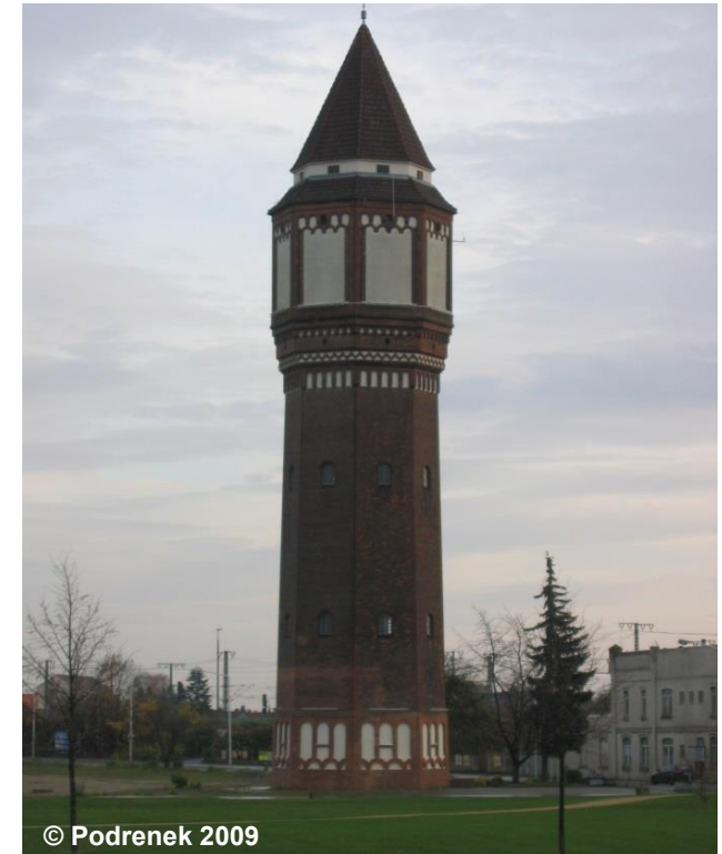
Blick auf den stillgelegten Wasserturm

ZUS 2100 Außer Betrieb, stillgelegt, verlassen BWF 1001 Wasserturm (G) DAF 3600 Kegeldach NAM .... HHO 35