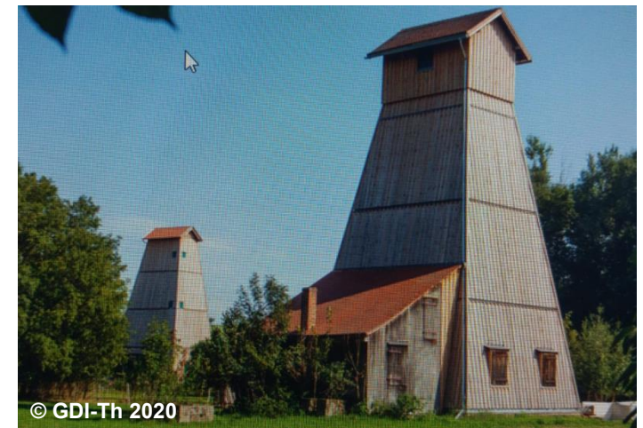
Blick auf den Bohrturm zur Solegewinnung