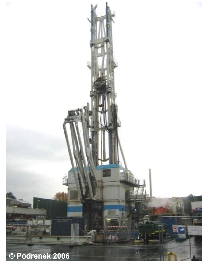
Beispiel für einen Bohrturm