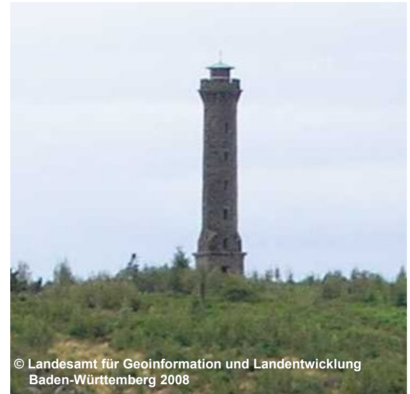
Blick auf den Mooskopfturm